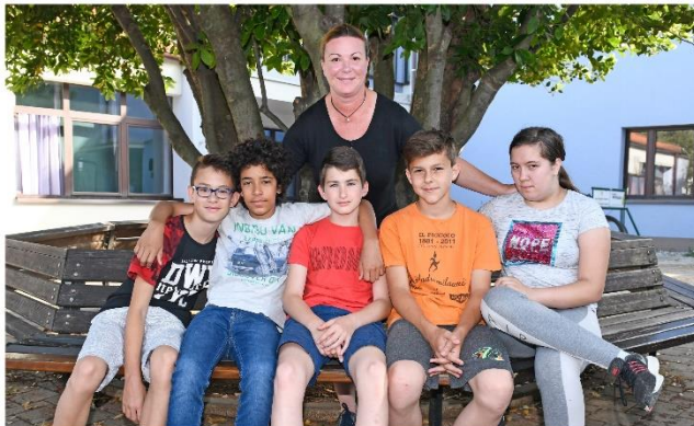
Sesta classe Anno scolastico 2018/2019