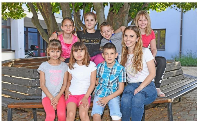
Terza classe Anno scolastico 2018/2019