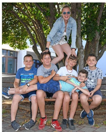
Quarta classe Anno scolastico 2018/2019