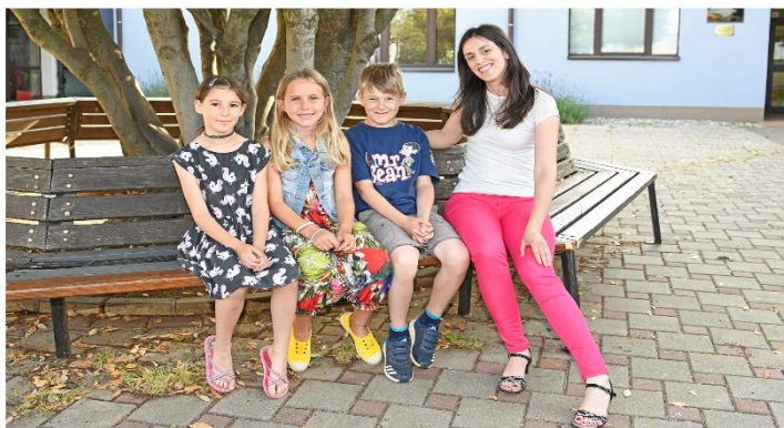
Prima classe Anno scolastico 2018/2019