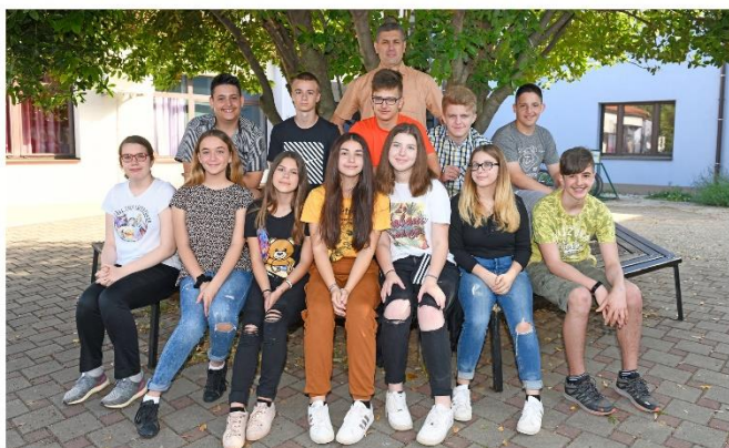
Settima classe Anno scolastico 2018/2019