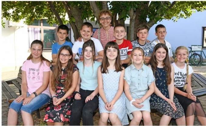
Quinta classe Anno scolastico 2018/2019