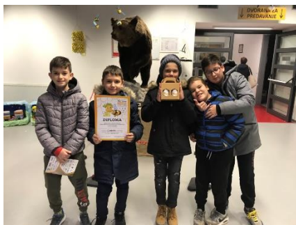
IV classe Giornate del miele a Pisino Lavoro artistico: "Apes operatur"